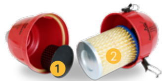
1 Grovsil 2 HEPA finfilter H13