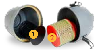
1 Grovsil 2 HEPA finfilter Inline